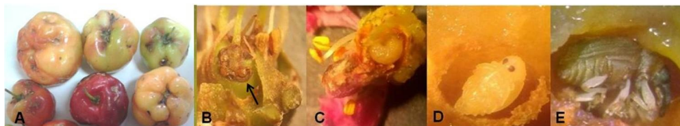
Figura 1. Daños ocasionados en botones florales y frutos. A) frutos de acerola deformados; B) deformaciones en forma de verrugas color café; C) larva penetrando el fruto; D) daño en la semilla al crear la cámara pupal; E) adulto apto para emerger del fruto.

Las características taxonómicas del coleóptero detectado en flores y frutos de M. emarginata coinciden con las descripciones informadas por Clark (1987), para A. sisyphus . Según este autor, existen algunas variaciones morfológicas entre los especímenes de acuerdo con la región