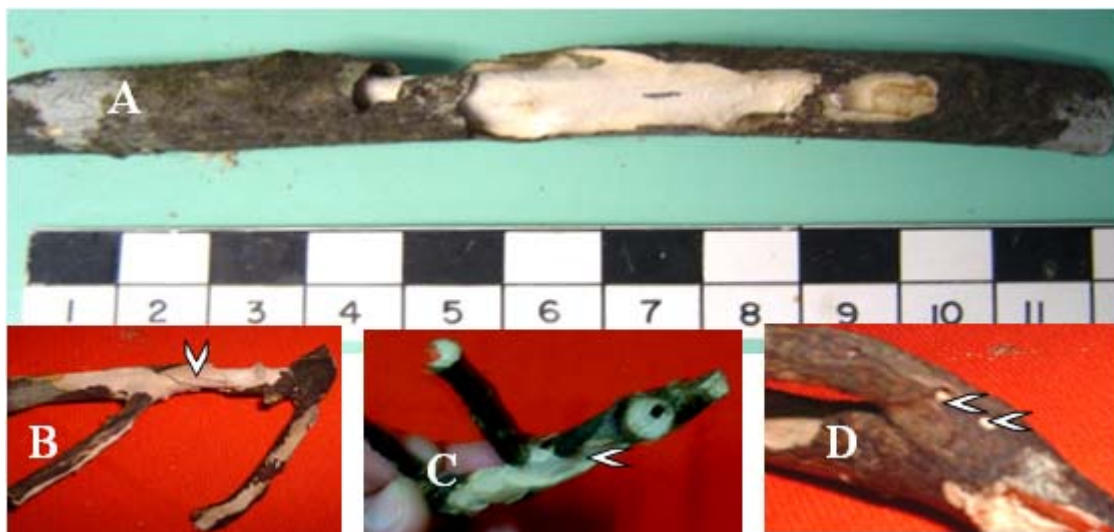
Figura 2. Daño producido por Elaphidion sp.n. en ramas cítricas. A. Galería en entre la corteza y la médula. B y C. Galería irregularmente espiralada. D. Orificio en la corteza por donde la larva expulsa el serrín al medio.

La galería de Elaphidion . sp.n. es de sección ligeramente circular en las ramas finas y puede ser largamente ovalada en las ramas más gruesas, al