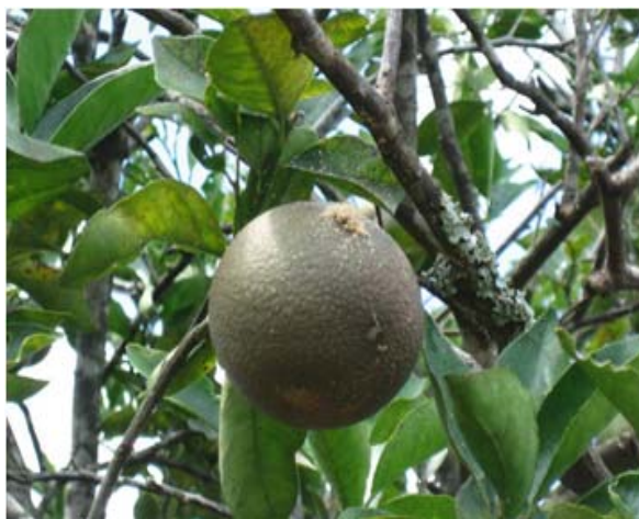
Figura 3. Presencia de serrín expulsado al exterior por larva de Elaphidion sp.n. sobre un fruto de naranja ( Citrus sinensis (L.) Osb.).

Grillo y Valdiviés (1991) encontraron que las larvas de la especie Elaphidion cayamae Fisher, no expulsan el serrín y sus excretas hacia el exterior, y dejan la galería fuertemente rellena de estos materiales.