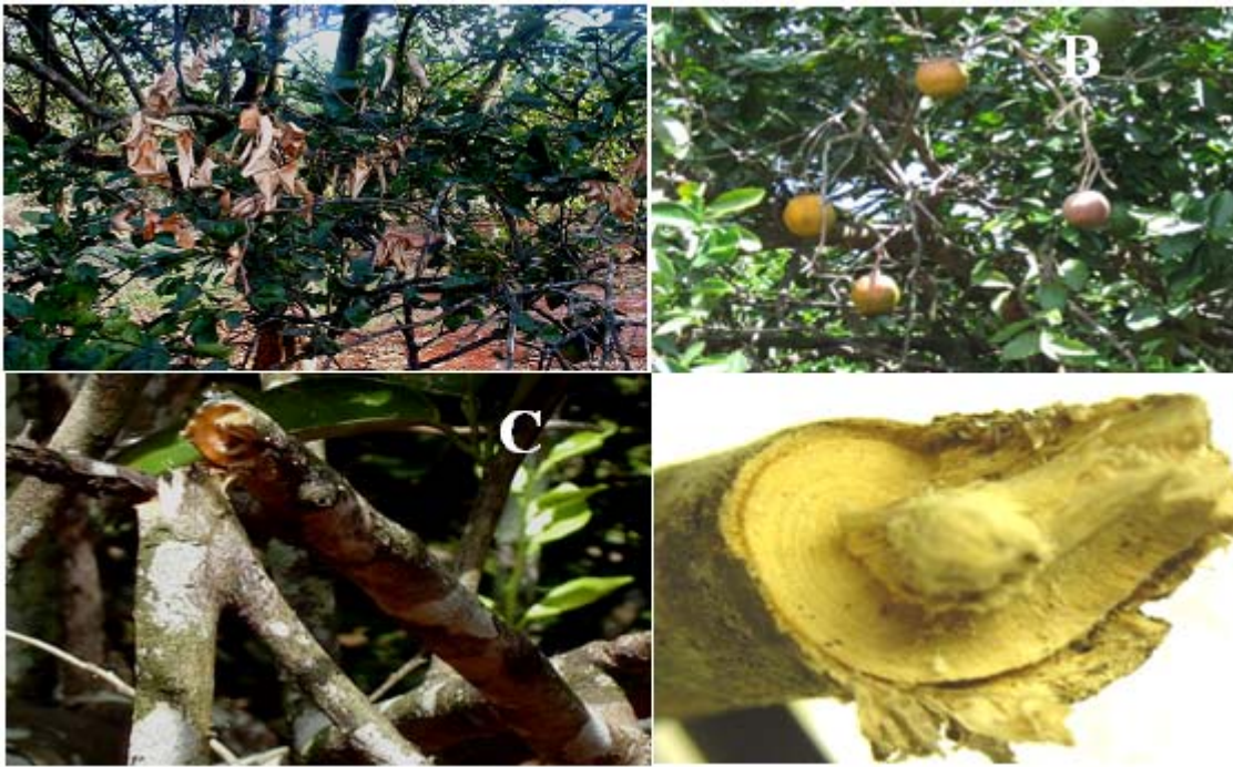
Figura 1. Síntomas del daño producido por Elaphidion sp.n. en plantas cítricas. A. Ramas terminales secas completamente. B. Síntomas de ramas secas con frutos. C y D. Corte helicoidal en las ramas cítricas.

A partir de la zona de anillamiento, la rama afectada exuda goma lo que unido al secado de la rama indica la presencia del ataque. Este tipo de daño es característico de varias especies de cerambícidos que se conocen con el nombre común de anilladores, cuyas larvas necesitan alimentarse de madera seca. Resultados similares observaron Machado et al. (2007) y García (1995 a) en ramas cítricas afectadas por las especies Epacrolon cruciatum (Aurivillius, 1899) y Campsocerus violaceus (White, 1853) en Sao Pablo, Brasil.